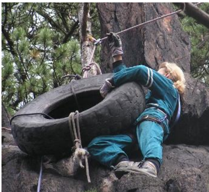
Text a foto Bohouš