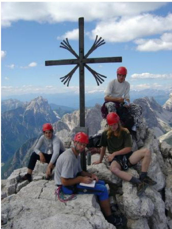
Na vrcholu Cima Grande

spokojenosti. Zde jsme použili jednoduchá lana, oproti cestám v horách. Tam přišla na řadu lana 1/2 v kombinaci s Gi-Gi brzdou, na každém laně měl instruktor jednoho začátečníka.